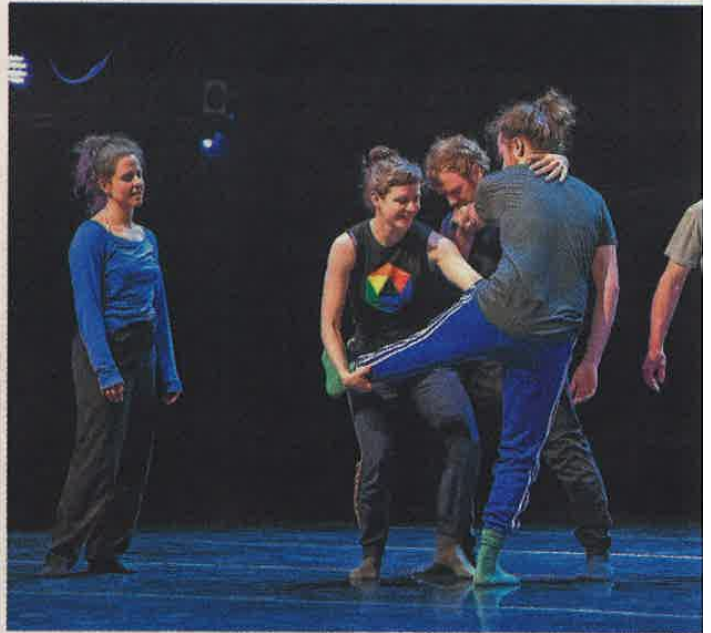
Les danseurs de la compagnie Le fils d'Adrien danse répètent devant public aujourd'hui et demain au Centre culturel de l'Université de Sherbrooke.

La première du spectacle Partition blanche se fera en février 2018