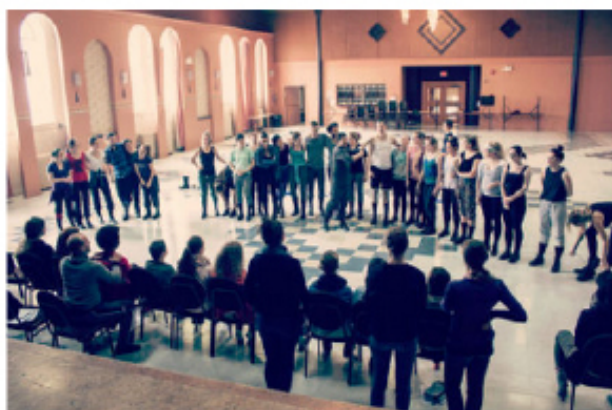
Photo : Répétition pour le spectacle Marche mémoire danse Source: lefilsdadrrien.ca