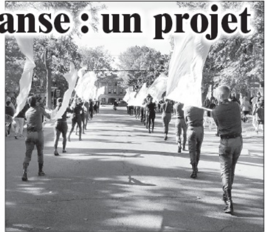
La troupe Marche Mémoire Danse remonte la rue Great George en déployant des drapeaux blancs.

Le spectacle Marche Mémoire Danse est décrit comme un spectacle déambulatoire. Après le tableau du départ, conçu pour le front de mer au bas de